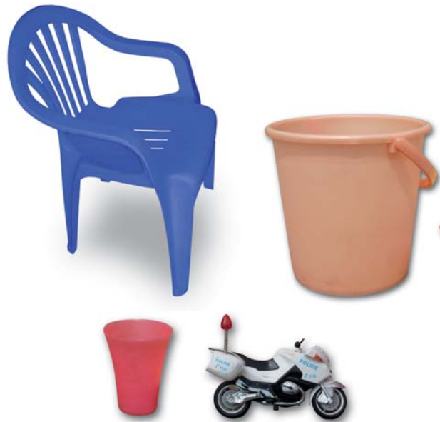
चित्र 3.7 : प्लास्टिक-निर्मित विभिन्न वस्तुएँ।

प्लास्टिक की वस्तुएँ सभी सम्भव आकारों और साइजों में उपलब्ध हैं, जैसा आप चित्र 3.7 में देख सकते हैं। क्या आपको आश्चर्य नहीं होता कि यह कैसे संभव है? तथ्य यह है कि प्लास्टिक आसानी से साँचे में ढाला जा सकता है अर्थात् इसे कोई भी आकार दिया जा सकता है। प्लास्टिक का पुनः चक्रण हो सकता है, इसे पुनः प्रयुक्त किया जा सकता है, इसे रँगा और पिघलाया जा सकता है, इसे बेलकर चद्दरों में बदला जा सकता है अथवा इसकी तारें बनायी जा सकती हैं। इसलिए इनके इतने विभिन्न प्रकार के उपयोग हैं।