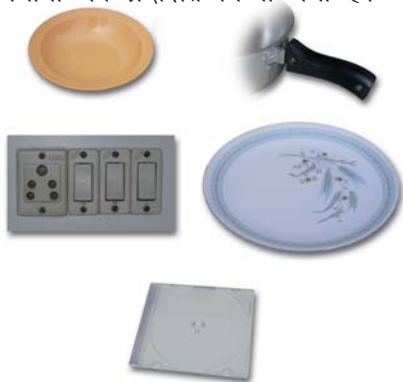
थर्मोसेटिंग प्लास्टिक से निर्मित वस्तुएँ

दूसरी ओर, कुछ प्लास्टिक ऐसे हैं जिन्हें एक बार साँचे में ढाल दिया जाता है तो इन्हें ऊष्मा देकर नर्म नहीं किया जा सकता। ये थर्मोसेटिंग प्लास्टिक कहलाते हैं। दो उदाहरण हैं - बैकेलाइट और मेलामाइन। बैकेलाइट ऊष्मा और विद्युत का कुचालक है। यह बिजली के स्विच, विभिन्न बर्तनों के हत्थे, आदि बनाने में काम आता है। मेलामाइन एक बहुउपयोगी पदार्थ है। यह आग का प्रतिरोधक है तथा अन्य प्लास्टिक की अपेक्षा ऊष्मा को सहने की अधिक क्षमता रखता है। यह फर्श की टाइलें, रसोई के बर्तन और कपड़े बनाने के उपयोग में लिया जाता है जो आग का प्रतिरोध करते हैं। चित्र 3.8 में थर्मोप्लास्टिक और थर्मोसेटिंग प्लास्टिक के विभिन्न उपयोगों को प्रदर्शित किया गया है।