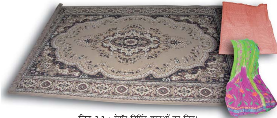
चित्र 3.2 : रेयॉन निर्मित वस्तुओं का चित्र।

आपने कक्षा VII में पढ़ा है कि रेशम कीट से प्राप्त किया जाता है। इसकी खोज चीन में हुई थी और इसे लम्बे समय तक कड़ी सुरक्षा में गोपनीय रखा गया। रेशम रेशे से प्राप्त कपड़ा बहुत मँहगा होता है परन्तु इसकी सुन्दर बुनावट (texture) ने प्रत्येक व्यक्ति को मोह लिया। रेशम को कृत्रिम रूप से बनाने के प्रयास किये गए। उन्नीसवीं शताब्दी के अन्तिम छोर पर वैज्ञानिकों को रेशम समान गुणों वाले रेशे प्राप्त करने में सफलता प्राप्त हुई। इस प्रकार का रेशा काष्ठ लुगदी के रासायनिक उपचार से प्राप्त किया गया। यह रेशा रेयॉन अथवा कृत्रिम रेशम कहलाया। यद्यपि रेयॉन प्राकृतिक स्रोत काष्ठ लुगदी से प्राप्त किया जाता है, यह एक मानव निर्मित रेशा है। यह रेशम से सस्ता होता है परन्तु इसे रेशम रेशों के समान बुना जा सकता है। इसे रंगों की कई किस्मों में रँगा जा सकता है। रेयॉन को कपास के साथ मिलाकर बिस्तर की चादरें बनाते हैं अथवा ऊन के साथ मिलाकर कालीन या गलीचा बनाते हैं। (चित्र 3.2)।