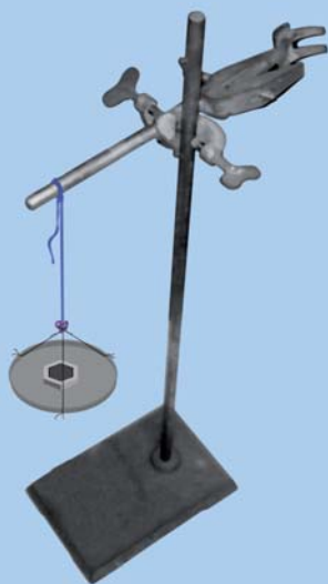
चित्र 3.5 : एक लोहे के स्टैंड पर क्लैम्प से लटकता हुआ एक धागा।

एक क्लैम्प युक्त लोहे का स्टैंड लीजिए। लगभग 60 सेमी लम्बा एक सूती धागा लीजिए। इसे क्लैम्प से बाँध दीजिए जिससे यह स्वतंत्र रूप से लटक जाए, जैसा चित्र 3.5 में प्रदर्शित है। मुक्त सिरे पर