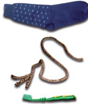
चित्र 3.3 : नाइलॉन से निर्मित विभिन्न वस्तुएँ।

हम नाइलॉन से निर्मित कई वस्तुओं को उपयोग में लाते हैं, जैसे— जुराबें, रस्से, तम्बू, दाँत साफ़ करने का ब्रुश, कारों की सीट के पट्टे, स्लीपिंग बैग (शयन थैला), परदे, आदि (चित्र 3.3)। नाइलॉन का उपयोग पैराशूट