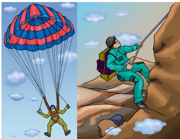
चित्र 3.4 : नाइलॉन रेशों के उपयोग।