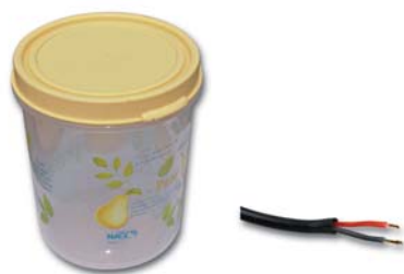
थर्मोप्लास्टिक से निर्मित वस्तुएँ