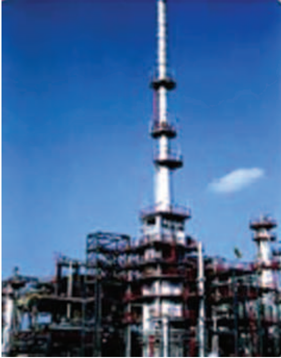
चित्र 5.5 : पेट्रोलियम परिष्करण।

को पृथक करने का प्रक्रम परिष्करण कहलाता है। यह कार्य पेट्रोलियम परिष्करण में सम्पादित किया जाता है (चित्र 5.5)।