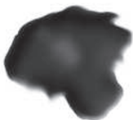
चित्र 5.3 : कोलतार।

यह एक अप्रिय गंध वाला काला गाढ़ा द्रव होता है (चित्र 5.3)। यह लगभग 200 पदार्थों का मिश्रण