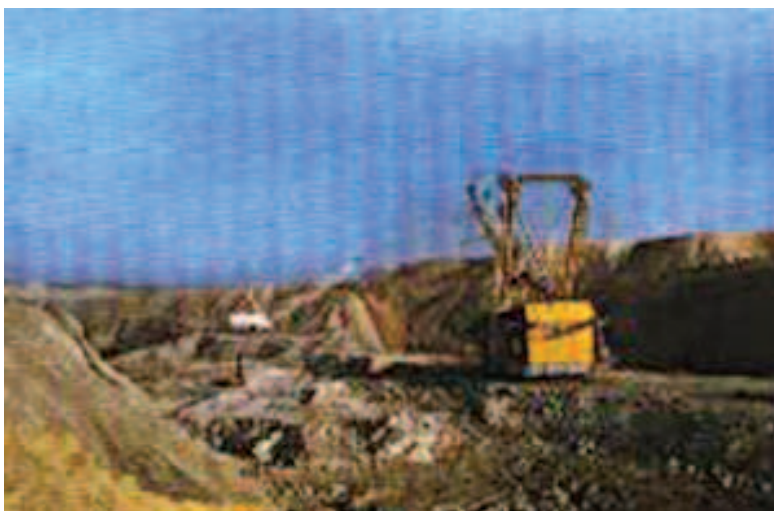
चित्र 5.2 : कोयले की एक खान।

वायु में गर्म करने पर कोयला जलता है और मुख्य रूप से कार्बन डाइऑक्साइड गैस उत्पन्न करता है।