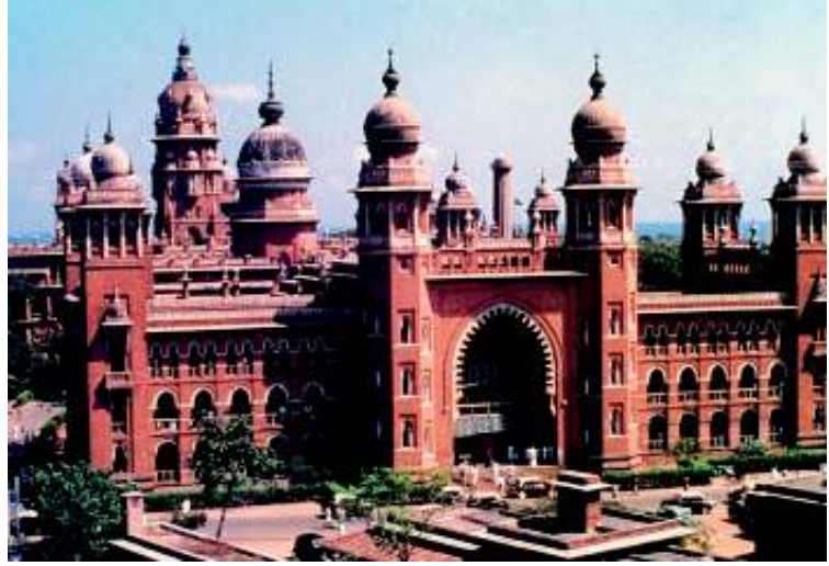
मद्रास उच्च न्यायालय

उच्च न्यायालयों की स्थापना सबसे पहले 1862 में कलकत्ता, बंबई और मद्रास में की गई ये तीनों प्रेसिडेंसी शहर थे। दिल्ली उच्च न्यायालय का गठन 1966 में हुआ। आज देश भर में 24 उच्च न्यायालय हैं। बहुत सारे राज्यों के अपने उच्च न्यायालय हैं जबकि पंजाब और हरियाणा का एक साझा उच्च न्यायालय चंडीगढ़ में है। दूसरी तरफ चार पूर्वोत्तर राज्यों असम, नागालैंड, मिजोरम और अरुणाचल प्रदेश के लिए गुवाहाटी में एक ही उच्च न्यायालय रखा गया है। आंध्र प्रदेश और तेलंगाणा का एक साझा उच्च न्यायालय हैदराबाद में है। ज्यादा से ज्यादा लोगों के नज़दीक पहुँचने के लिए कुछ उच्च न्यायालयों की राज्य के अन्य हिस्सों में शाखाएँ भी हैं।