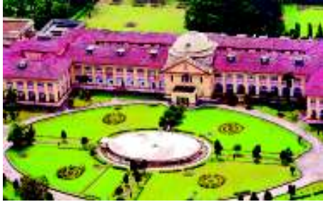
पटना उच्च न्यायालय

क्या विभिन्न स्तरों की ये अदालतें एक-दूसरे से जुड़ी हुई हैं? जी हाँ। भारत में हमारे पास एकीकृत न्यायिक व्यवस्था है। इसका मतलब यह है कि ऊपरी अदालतों के फैसले नीचे की सारी अदालतों को मानने होते हैं। इस एकीकरण को समझने के लिए अपील की व्यवस्था को देखा जा सकता है। अगर किसी व्यक्ति को ऐसा लगता है कि निचली अदालत द्वारा दिया गया फैसला सही नहीं है, तो वह उससे ऊपर की अदालत में अपील कर सकता है।